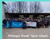
Pétanque Handi' Sport Adapté

03 25 01 06 48 / 07 89 98 64 06 philippe.mary52@orange.fr