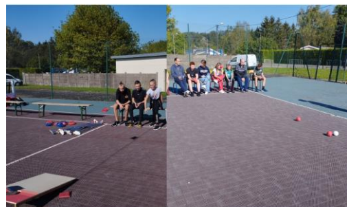
Sports de précision → Cornhole Boccia Curling