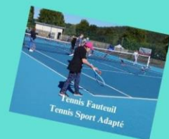
Tennis Fauteuil Tennis Sport Adapté