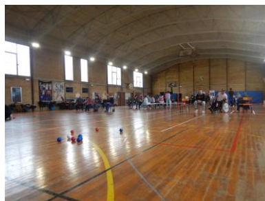
Mardi 27 février 2024 Une quinzaine d'équipes étaient présentes au challenge départemental