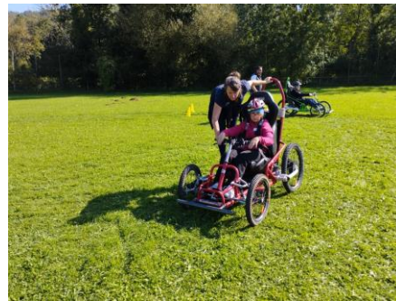
Ou en Fauteuil Tout Terrain →