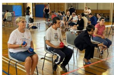
Activité Boccia discipline Paralympique Première Médaille d'OR aux jeux de Paris 2024