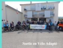
Sortie en Vélo Adapté