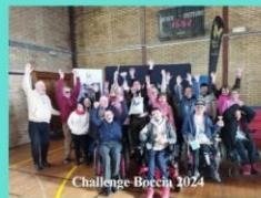
Challenge Boccia 2024