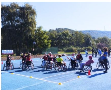
← Sports collectifs Passe à 10