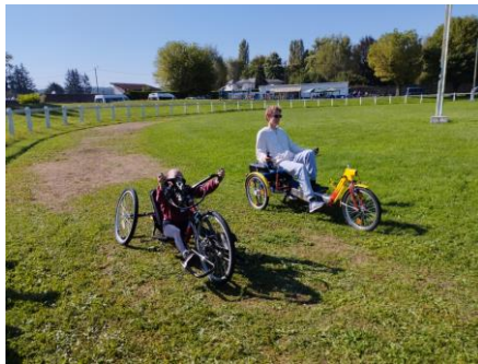
← Se déplacer en Vélo adapté

Rendez-vous le 18 septembre 2025 pour fêter la quinzième édition " Les Froncles HANDI'SPORTS "