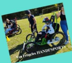
Les Froncles HANDISPORTS